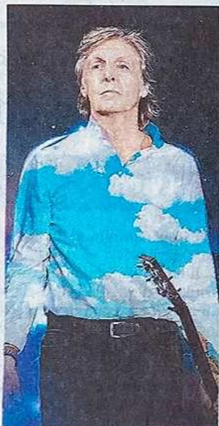
«Got Back». L'attuale foto ufficiale

BRESCIA. Abbiamo chiesto a Franco Zanetti, direttore editoriale di Rockol.it (il più importante quotidiano online a tema musicale in Italia) e tra i massimi esperti di Beatles, di spiegarci il ruolo di Paul McCartney nella storia della iconica band di Liverpool. Il giornalista e scrittore bresciano non si è fatto pregare: «McCartney è stato fondamentale nell'economia del gruppo, ne è stato il collante: altrimenti i Beatles non